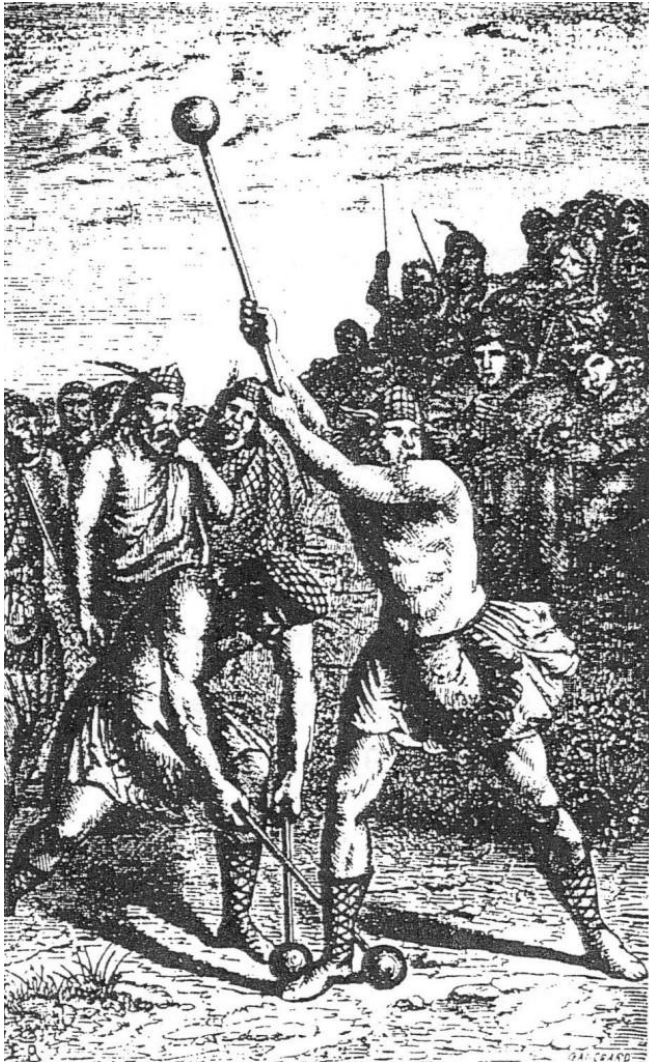
Abbildung 1: Schottischer Hammerwerfer

„It seems fairly certain, that throwing the hammer originated from men meeting at a blacksmith`s shop to have their horses shoed. As they waited, time would hang heavy, but some energetic youth would seize the blacksmith`s hammer and throw it some way, for his companions to follow, and thus start a diversion, which has never since been discontinued.“ 21